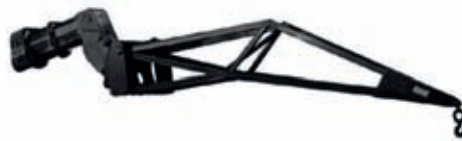
Plumín y diversos ganchos de carga