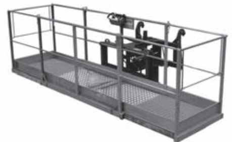
Cesta de trabajo sólo para TL 435-13 y TL 442-13